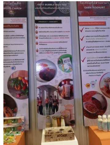
ภาพกิจกรรม 2 Thailand Tech Show 2020 (virtual)